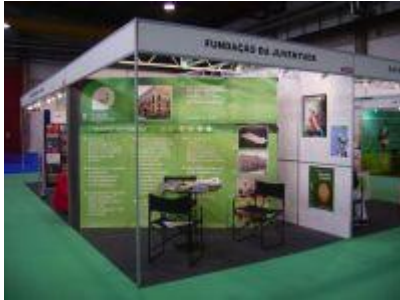
Fundação da Juventude